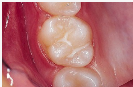
Schutz vor Karies: Versiegelung der feinen Grübchen auf der Kaufläche

Bei der Versiegelung werden die Fissuren mit einem hellen Kunststoff dauerhaft verschlossen, so dass an diesen Stellen keine Karies mehr entstehen kann (siehe Abb. unten).